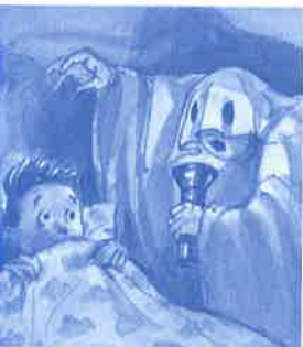
Le chien s'amuse à faire peur à son frère.

peur nom féminin. La peur, c'est une émotion très forte que l'on ressent lorsque l'on est en face d'un danger. Anne a peur des chiens . Richard a eu peur quand il a entendu l'explosion , son cœur s'est mis à battre très vite.