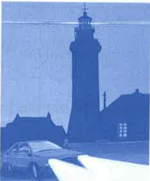
Le phare indique aux bateaux l'entrée du port. La voiture a ses phares allumés.

phare nom masculin. 1. Un phare, c'est une haute tour, au bord de la mer, avec à son sommet une grande lumière qui guide les bateaux pendant la nuit. 2. Les phares d'une voiture, ce sont les lumières placées à l'avant d'une voiture pour éclairer la route quand on roule la nuit.