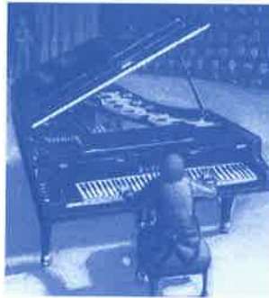
Le pianiste donne un concert.

pianiste nom masculin et féminin. Un pianiste, une pianiste, c'est une personne dont le métier est de jouer du piano.