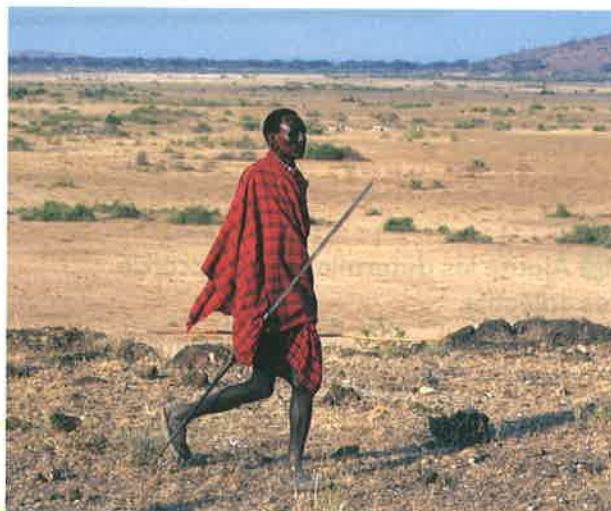
Guerrier massaï marchant dans la savane.

2. Repère les marques du pluriel et du féminin des adjectifs.